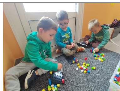
Réaliser des collections