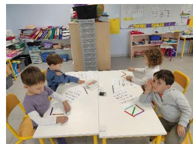
Se repérer dans l'espace avec les bâtonnets