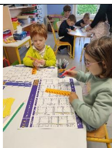
Tracer des lignes verticales