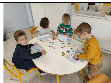
Boîte à compter