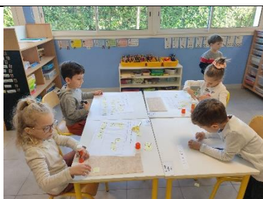
Trier des lettres/chiffres/signes