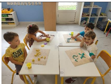
Numération : former les chiffres avec de la pâte à modeler