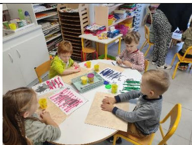
Réaliser des lignes verticales