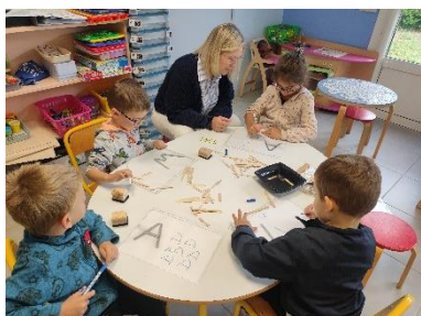
Former et écrire son initiale