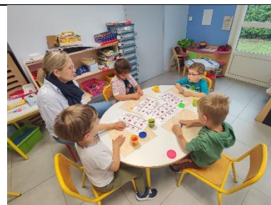
Motricité fine avec de la pâte à modeler