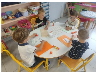
Retrouver son initiale