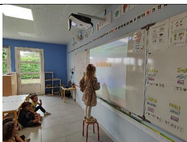
Recherche des lettres de l'alphabet