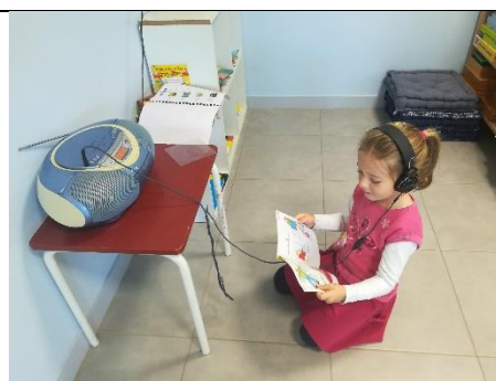
Ecouter une histoire