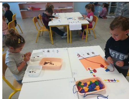
Enfiler des formes