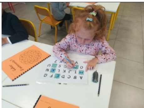
Retrouver et écrire les lettres manquantes