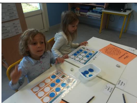
Compter le nombre de syllabes