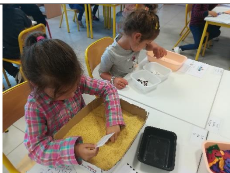
Tracer des graphismes