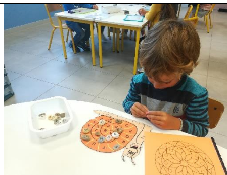
Retrouver les lettres de l'alphabet