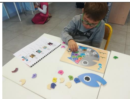
Reconstituer le puzzle de l'alphabet