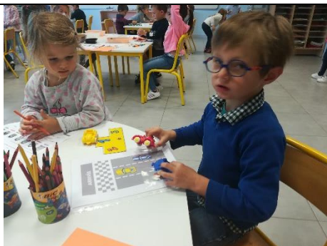
Classer des voitures en fonction de l'ordre d'arrivée

Nous avons commencé à travailler avec de nouveaux ateliers : quand notre travail est terminé, à nous de choisir ce que nous souhaitons faire pour continuer à nous entraîner dans nos activités :